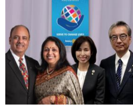
写真左 2021-22年RI会長 Shekhar-Mehta