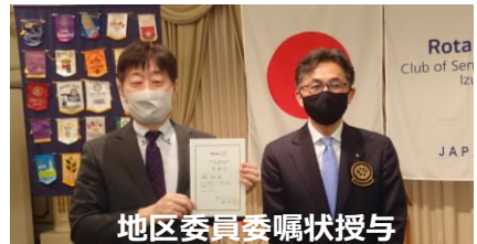
地区委員委嘱状授与