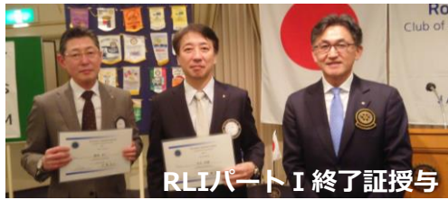
RLIパートI 終了証授与