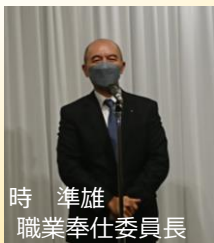
職場訪問終了後、斎苑さんにて昼食。